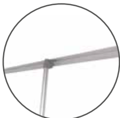
Pinza de sujeción de imagen