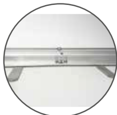
Anclaje de mástil reforzado