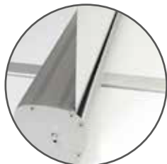
Aluminio de gran calidad

Una estructura muy efectiva y reutilizable. Ideal para ferias, vestíbulos, escaparates, exposición y ventas entre otros.